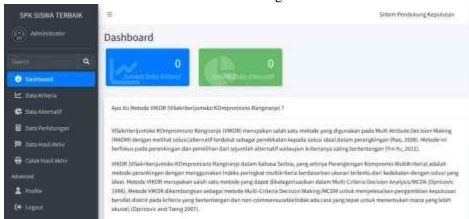
Gambar 2 Halaman Home (Dashboard)