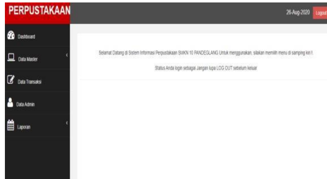
Gambar 3 menu program utama